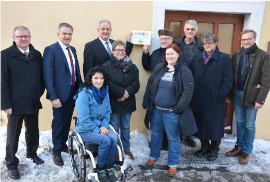
18.01.2017 - Verleihung Signet „Bayern barrierefrei“ an das Pfarr- und Jugendheim Leonberg