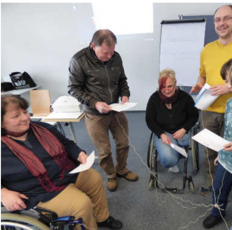
18.02.2017- Dritter Baustein „Demokratie-Werkstatt für Alle“ - „Vom Glück dazugehören“

Was heißt Inklusion, auch ganz praktisch